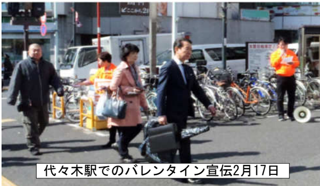
代々木駅でのバレンタイン宣伝2月17日