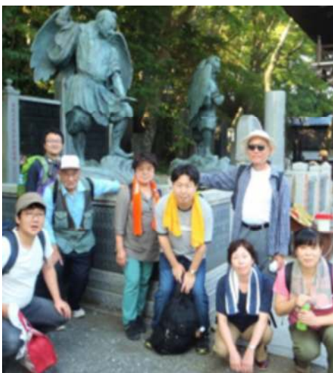
高尾山の天狗様の前で拡大奮闘を誓う しぶやのみなさん

渋谷支部は、次期定期大会まで200人の到達をめざし、年間80人、秋の拡大は40人目標です。大会時の1年間で24人増ですから、3倍を上回る目標へ挑戦です。達成にふさわしい運動をと8月28日、日本高齢者大会の大正大学で宣伝、1000枚のチラシ配布。駅頭では、9月1日、代々木、10月4日、千駄ヶ谷、10月6日、代々木と3回、のべ17人、650枚を配布、9月25日渋谷母親大会100枚、10月10日しぶや平和まつりでは、舞台上で最賃クイズや「団結マーチ～ボク