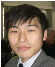
日本共産党・山添議員

建も10、11月拡大とりくみ4950人増やした。CU東京を物心両面で支援していきたい」、山添議員はこの間の共産党の果たした役割を紹介し、「働く者の権利を守る活動は極めて重要、共同して奮闘していきたい」と激励、挨拶しました。