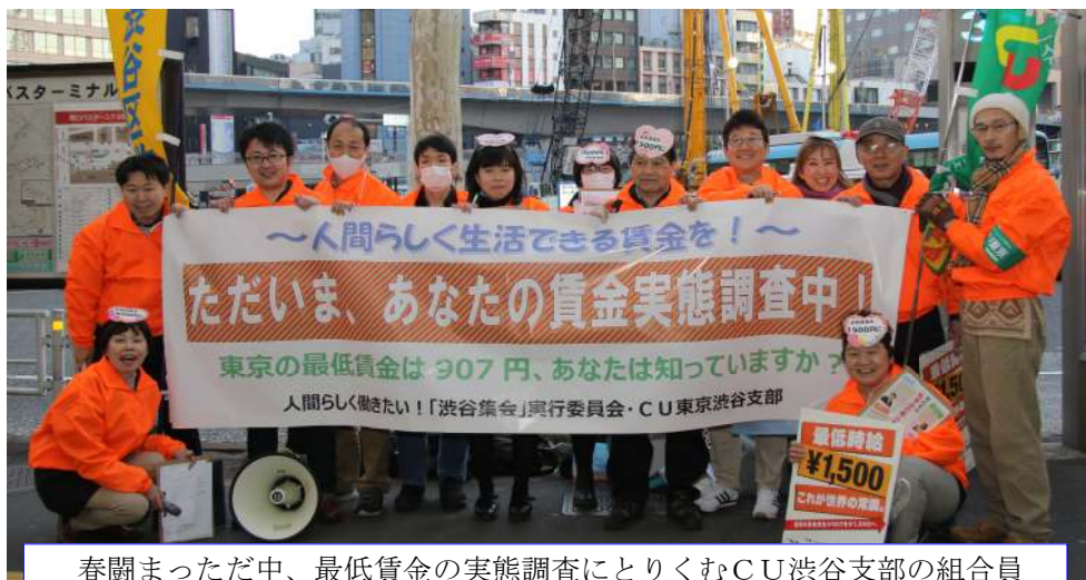
春闘まっただ中、最低賃金の実態調査にとりくむCU渋谷支部の組合員