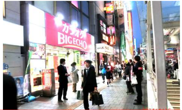
第一興商（ビッグエコー）上野駅前店前宣伝行動

2013年12月法律事務所とも相談の上、団体交渉申入れ。2014年1月、第1回目の団体交渉が行われました。団交では、会社側はハラスメントについてははまともな回答をせず、長時間労働について